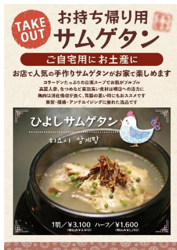
持ち帰りサムゲタン案内ポスター