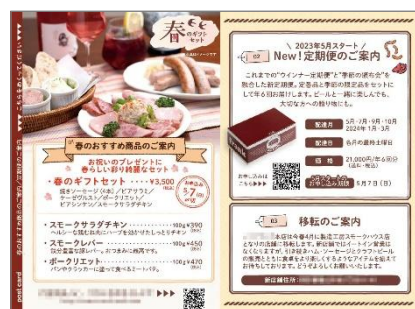
春季案内2つ折りハガキ