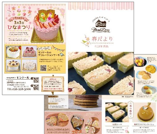
リーフレット(A4 サイズ/2つ折り)