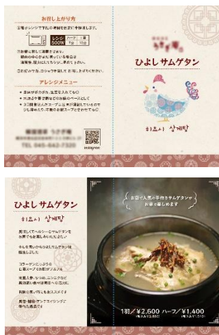
リーフレット (横 200mm×縦 148mm/2つ折り)