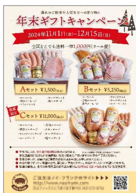
A4 サイズ P0P