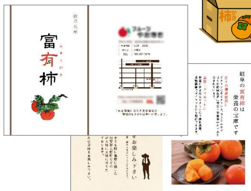
富有柿同梱リーフレット(A4 サイズ/2つ折り)