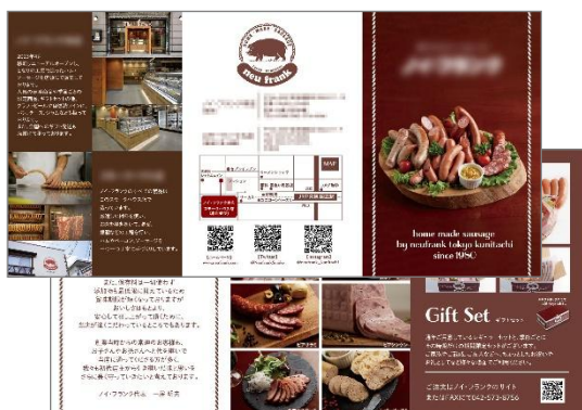
リーフレット(横 297mm×縦 148mm/巻き三つ折り)