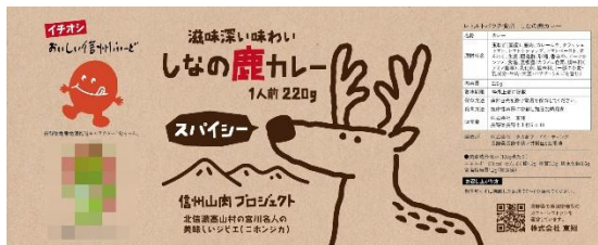
レトルトパック用掛け紙