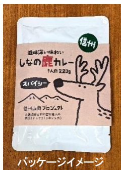
パッケージイメージ