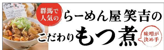
ブース上部装飾布 1500mm×450mm