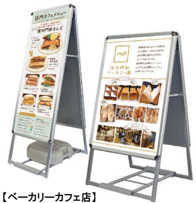
【ベーカリーカフェ店】 イートインテイクアウト案内