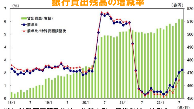
銀行貸出残高の増減率

(注) 特殊要因調整後は、為替変動・債権償却・流動化等の影響を考慮したもの 特殊要因調整後の前年比 = (今月の調整後貸出残高 - 前年同月の調整前貸出残高) / 前年同月の調整前貸出残高 (資料) 日本銀行