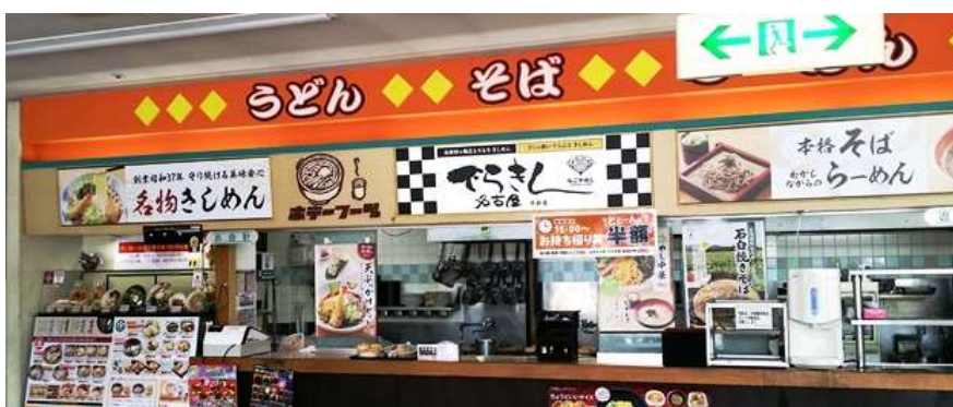
【店頭看板用シート 2種類】